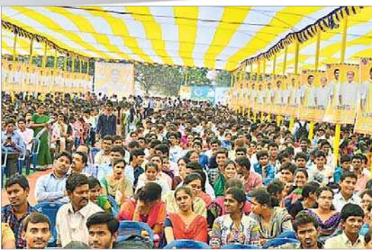
రాజమహేంద్రవరంలో నిర్వహించిన జాబ్ మేళాకు హాజరైన జనం(దాచిన చిత్రం)

జిల్లా గ్రామీణాభివృద్ధి సంస్థ ఆధ్వర్యంలో దీనదయాక్ గ్రామీణ కౌశల్ యోజన పథకం(డీడీయూజీకేవై) సౌజన్యంతో రాష్ట్ర ప్రభుత్వం ద్వారా జిల్లాలోని గ్రామీణ నిరుద్యోగ యువతకు గత నాలుగేళ్లలో శిక్షణ ఇచ్చారు. జిల్లాలోని అయిదు కేంద్రాల ద్వారా 8వ తరగతి నుంచి డిగ్రీ వరకూ చదివిన విద్యార్థులకు వివిధ కోర్సుల్లో శిక్షణ ఇచ్చి, ఉద్యోగాలు కల్పించారు. 2014-2018 మధ్య పలువురికి శిక్షణ ఇచ్చి 18,50 మందికి ఉద్యోగ అవకాశాలు కల్పించారు. ప్రస్తుతం అయిదు కేంద్రాల్లో 225 మంది వివిధ కోర్సుల్లో శిక్షణ పొందుతున్నారు.