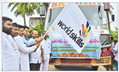
ఉద్యోగ మేళాలో ఎంపికైన యువతను బస్సులో పంపుతున్న ఉపముఖ్యమంత్రి చినరాజప్ప తదితరులు(దాచిన చిత్రం)

హించడంతో పాటు వారిలో క్రీడానైపుణ్యాలను పెంచేందుకు ఒక్కొక్క సంఘానికి రూ.15 వేల విలువైన క్రీడాసామగ్రిని, నియోజక వర్గంలో 20 సంఘాలకు ఇచ్చేందుకు ఏర్పాట్లు చేస్తున్నారు.